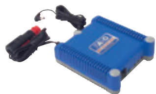
Cargador para el coche BC 10-30 VDC-PT

Peso 4,3 kg, Capacidad 5,2 Ah, Tensión 24 VDC Art. n° 004 150