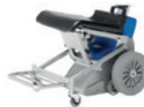
Barra plegable para los pies