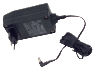
Cargador BC-PT (Euroconector)

Los accesorios para el sube-escaleras LIFTKAR PT están especialmente diseñados para satisfacer las necesidades y requerimientos individuales de las personas con dificultades para caminar. La calidad del diseño y de fabricación son de suma importancia.