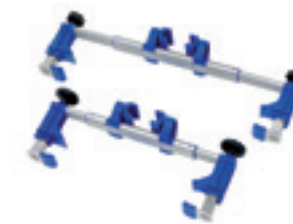
Abrazadera para PT Uni

Conector UK, art. n° 045 142 / Conector USA, art. n° 045 143 / Conector AUS, art. n° 045 144