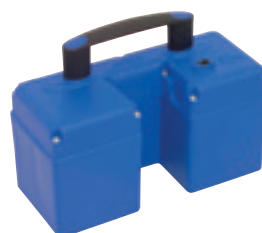
Batería intercambiable BU-PT 5,2 Ah

Peso 4,3 kg, Capacidad 5,2 Ah, Tensión 24 VDC Art. n° 004 150