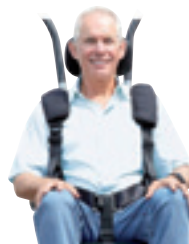
Diferentes sistemas de cinturón de seguridad

Anchura estándar 44 cm ampliada a 54 cm Art. n° 945 146