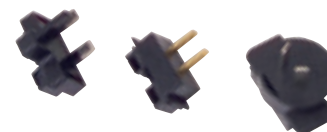
Adaptador para el cargador de la batería

Cinturón de 5 puntos, art. n° 945 144 / Cinturón de cadera, art. n° 945 118 / Cinturón de pecho y cadera, art. n° 945 158